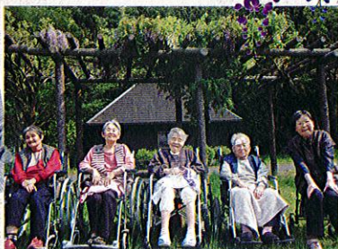
いいお天気には、外に出てリフレッシュ!