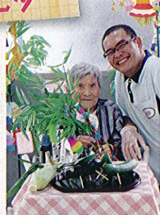
みんなの願いが届きますように