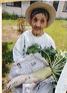
“ビックリ”するほどの 大きな大根が取れました(*_* )