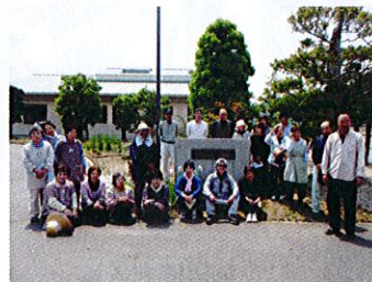
天理教 岡山教区東部支部 様

4月29日(土・祝)に天理教岡山教区東部支部の皆さまが、5月27日(土)に黒住教磯上教会所の皆さまが、施設の草刈・草取に来てくださいました。ご協力下さいました皆さま、ありがとうございました。