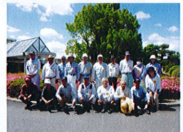
黒住教 磯上教会所 様