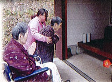
今年もおかげを頂きに参りました